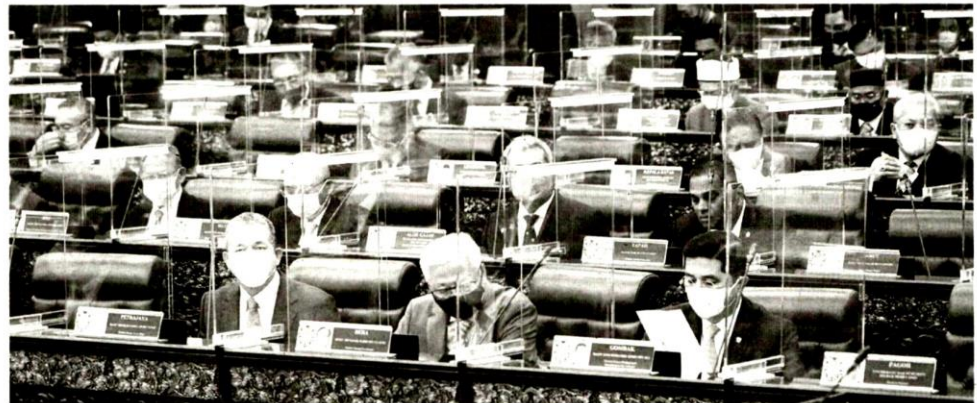
SEORANG wakil rakyat ada hubungan fidusiar dengan pengundinya berasaskan prinsip amanah yang diletakkan ke atasnya untuk sentiasa bertindak mengutamakan kepentingan pengundinya, bukan mengutamakan kepentingan peribadinya.

Kesemua plaintiff merupakan pengundi di kawasan Gombak yang telah mengundi defendan dalam