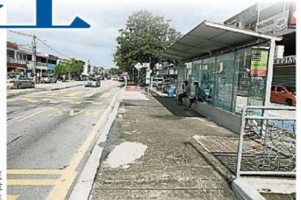
民众也建议八打灵再也市政厅提升SS2/55路的巴士亭,加宽其屋顶,让遮阳功能变得更全面。