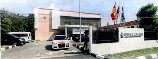
■卡末丽雅多用途礼堂由森那美产业集团于2017年3月动工, 至今年10月竣工。

礼堂耗资385万令吉, 由森那美产业集团于2017年3月动工, 至今年10月竣工。