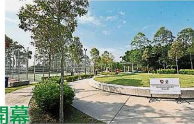
布特拉高原休闲公园除了备有基本设施，公园内也有长达5公里的跑道、篮球场、足球场等。