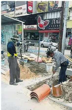
工人在SS2/55路边建设排水沟,并尽量挖深沟渠,让路面的积水能迅速被排入沟渠里。