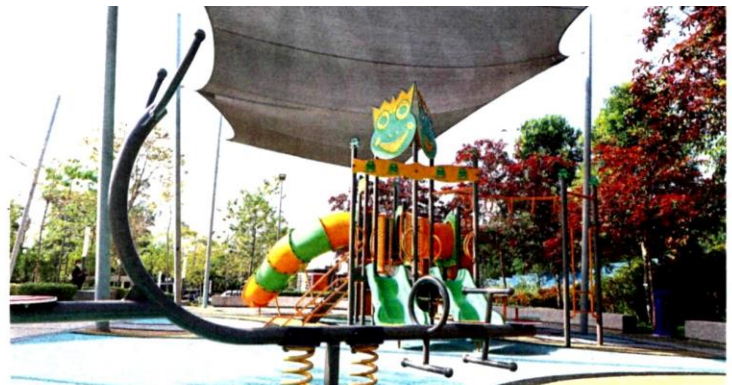
Taman Rekreasi Putra Heights offers facilities such as a 600sqm play park, a basketball court, futsal court, 5km-long jogging and bicycle track, and 4.5km-long tactile pathway.

Heights LRT Station. The linear park, measuring about 1km in length, connects to Kingsley Hill and runs parallel to the Elite Expressway. It offers facilities such as a 600sqm play park, a basketball court, futsal court, 5km-long jogging and bicycle track, 4.5km-long tactile pathway, eight shelters, toilets as well as 47 parking bays for vehicles and motorcycles. Construction of the RM5mil park began in June 2017, followed by some maintenance works in March 2018 before its handover this month. Taman Rekreasi Putra Heights and Taman Kejiranan are the two main parks in Putra Heights. There are also pocket parks within the many neighbourhoods of the 688ha township. Meanwhile, Dewan Camelia is a 4,519.8sqm community hall located on 0.4ha land that was built at a cost of RM3.85mil. Construction began in March 2017 and was completed in October this year. It houses three badminton courts, a volleyball court, a stage, changing rooms, toilets, surau and audio facilities along with 30 parking bays. "It will be nice if Taman Rekreasi Putra Heights is linked to the town