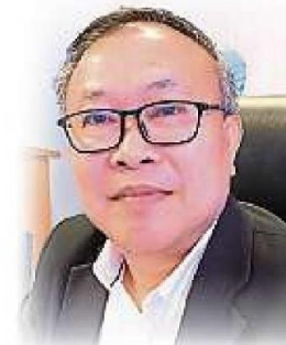
阿里苏海里公布雪州苏丹于今年华诞,在册封有拿督及以上勳銜的有功臣民中,只有2名皇室成员和31人受封。

州王宫无法如同往年,择定在巴生阿南沙王宫举行册封仪式的日期,一切仍有待王宫方面向新闻局做正式通知而定。