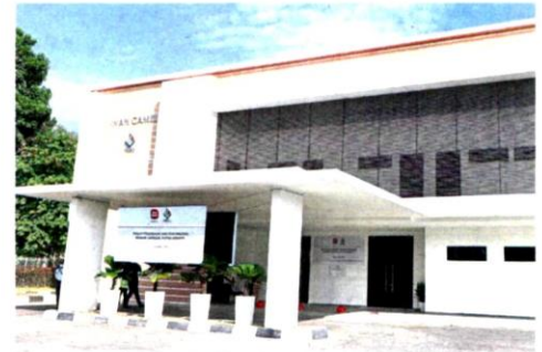
Dewan Camelia in Putra Permai, Section 10, has three badminton courts as well as a volleyball court.