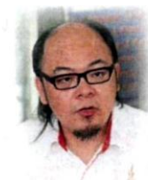
大爆发。 强管令，免引发疫情 李富豪：尽速采取