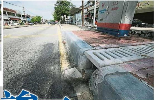
SS2/55路的排水沟建设工程已竣工,相信可有效解决路面积水问题。