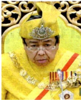
SULTAN SHARAFUDDIN IDRIS SHAH