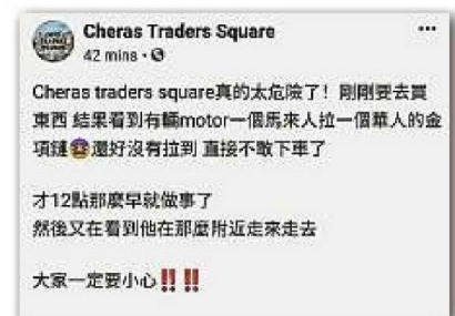
网民日前目睹一名事主险被攫夺项链，促民众提高警惕。