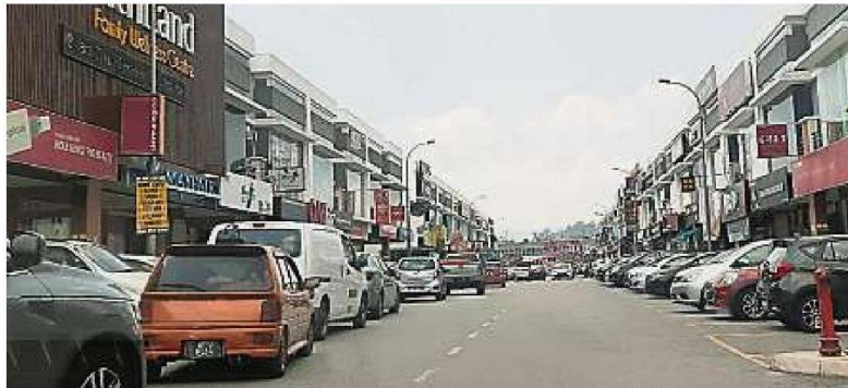
蕉赖南区鸿贸商城每个月上演砸车镜爆窃及攫夺案，治安败坏情况越来越严重。