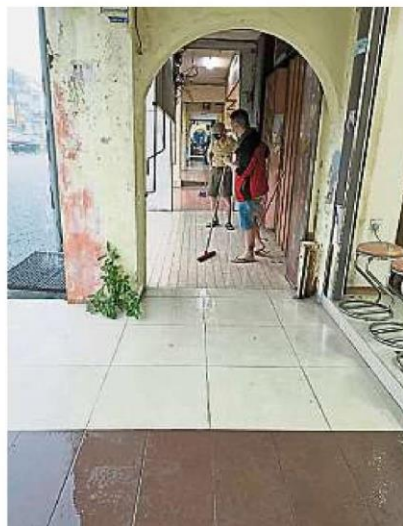
万撓后街商民眼见路面开始积水后，提起扫把严阵以待。

他指出，鹅唛县水利灌溉局官员因某些原因，还未将升压水泵的钥匙交给商民，造成后街的升压水泵较迟开启，才会导致街道上出现路面积水。