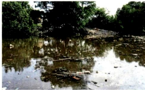
Kedudukan Sungai Aur Pandamaran, Klang yang dipenuhi sampah sarap dan kotor.