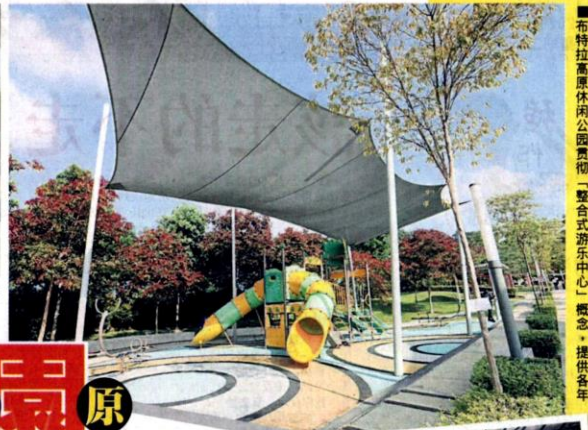
■为居民提供休闲设施的「整合式游乐中心」概念, 提供各年龄层居民的休闲设施。